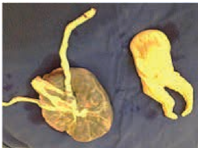
Figura 4: Aspecto macroscópico do gemelar e da placenta após o nascimento.

• Placenta monócóricia e diâmiótica; os dois cordões umbilicais mostram apenas dois vasos (artéria umbilical única), sendo que um deles está desvitalizado. As membranas amnióticas de uma das cavidades igualmente exibem áreas de desvitalização (mesma lateralidade do cordão desvitalizado); disco placentário exibindo congestão vascular vilositária e áreas de infarto (necrose isquêmica). Feto com malformação acardia-acefalia.