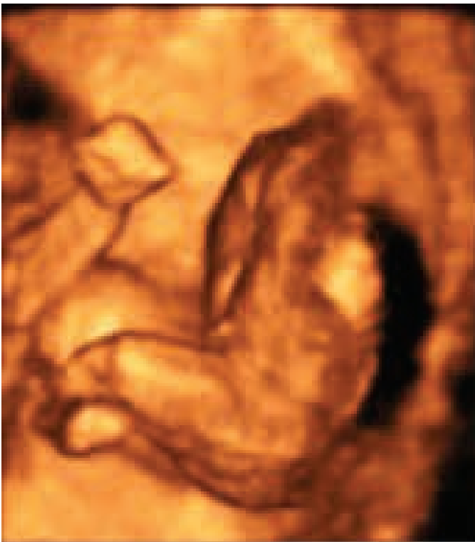
Figura 1: Ecografia tridimensional demonstrando o abdômen e o tórax do gemelar acárdico (ausência dos membros superiores e crânio).

A paciente foi encaminhada ao Setor de Medicina Fetal do Hospital Universitário de Santa Maria, onde foi avaliada e, considerando-se a hipótese de sequencia TRAP, foi referenciada ao setor de Medicina Fetal do Hospital Universitário Antonio Pedro, onde realizou ecografia com 24 semanas e 1 dia, onde se