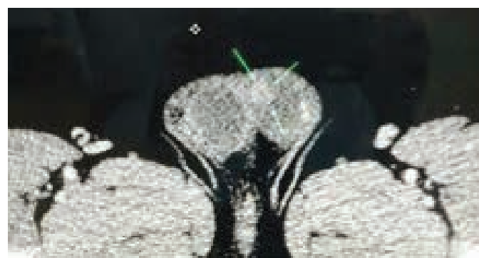
Figura 2: Tomografia computadorizada da bolsa escrotal mostrando imagem nodular na fase pós-contraste medindo 1,2 cm.