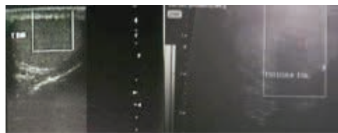
Figura 1: Ultrassonografia dos testículos. (a) Testículo direito. (b) Testículo esquerdo: verifica-se imagem hipoeoica no polo inferior testicular.

(Figura 4). O termo de consentimento livre e esclarecido foi assinado pelo responsável em nome do paciente.